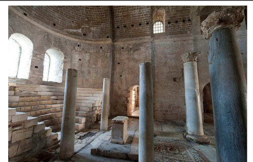
Eglise saint Nicolas de Myre

“Bon saint Nicolas, protecteur des enfants et de tous ceux qui le demandent, bénis-moi et fais-moi connaître la joie du Seigneur Jésus !”