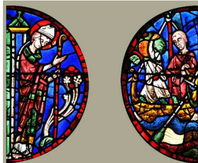
Vitraux de la cathédrale de Chartres

6-Une grande famine sévit. Saint Nicolas demande à des marins qui transportent des sacs de blé d'en donner aux habitants. Ils acceptent et retrouveront la même quantité de blé à leur arrivée. Saint Nicolas a accompli un miracle en multipliant le contenu de la cargaison.