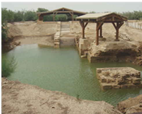
Lieu du baptême du Christ aujourd'hui, aux bords du Jourdain (Israël / Jordanie)