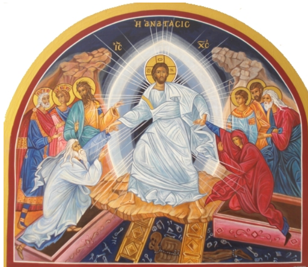
Adam et Eve arrachés aux enfers.

Le Christ est ressuscité des morts. Par la mort Il a vaincu la mort. A ceux qui sont dans les tombeaux Il a donné la vie.