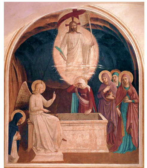
La Résurrection, Fra Angelico, 1440-41

La Résurrection du Christ dévoile la Résurrection personnelle et universelle. L'homme a été créé pour l'immortalité, et par sa Résurrection, le Christ nous ouvre les portes du Royaume des Cieux.