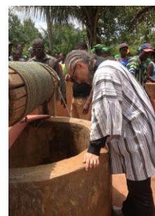
Construction de puits au Burkina Faso